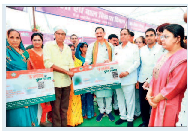
हमारी सरकार सभी क्षेत्रों में लगातार विकास के कार्य कर रही है। प्रदेश में स्वास्थ्य सुविधाओं को दुरुस्त किया जा रहा है। 5 नये मेडिकल कॉलेज खोले जा रहे हैं, चिकित्सकों एवं अन्य स्टाफ की भी भर्ती शुरू हो गई है।

सुशासन तिहार ब्लॉक के ग्राम पंचायत वटगन में सोमवार को आयोजित समाधान शिविर में जिले के प्रभारी एवं स्वास्थ्य मंत्री श्याम बिहारी जायसवाल मुख्य अतिथि के रूप में शामिल हुए। इस अवसर पर उन्होंने ग्राम पंचायत वटगन में सीसी रोड निर्माण, कॉलेज में बाउंड्रीवाल निर्माण की स्वीकृति प्रदान की। इसके साथ ही विभिन्न योजना के हितग्राहियों को सामग्री व चेक का वितरण किया। कार्यक्रम में मंत्री जायसवाल ने कहा कि सुशासन तिहार एक ऐसा तिहार है, जिसमें शासन और प्रशासन जनता के बीच पहुंचकर उनकी समस्याओं का समाधान कर उन्हें खुशी देने का प्रयास किया जा रहा है। मुख्यमंत्री विष्णु देव साय प्रदेश का दौरा कर लोगों के बीच पहुंच रहे हैं और योजनाओं की जमीनी हकीकत पर फीडबैक ले रहे हैं। उन्होंने कहा कि सभी अधिकारी-कर्मचारी अपने कार्यशैली में लोगों की समस्याओं के समाधान को सर्वोपरि रखें। शिविर में प्राप्त होने वाले आवेदनों पर गंभीरता पूर्वक विचार करते हुए तत्काल निराकरण करें, यहाँ निराकरण नहीं हो पाने वाले आवेदनों को 15 दिन में निराकरण सुनिश्चित करें। उन्होंने कहा कि