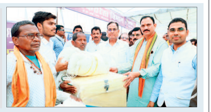
का जायजा लिया। उन्होंने तैनात चिकित्सक एवं स्टाफ से पूछ ताछ कर ओपीडी की संख्या, जांच सुविधा, दवाई की उपलब्धता की जानकारी ली। इस दौरान जांच कराने